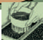
Recubrir las semillas con el mismo sustrato tamizado.