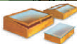
Diferentes modelos de semilleros calientes.