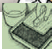
Rellenar la terrina con sustrato y compactarla ligeramente.