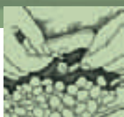
Arrancar las plantas con ayuda de algún pequeño instrumento terminado en punta.